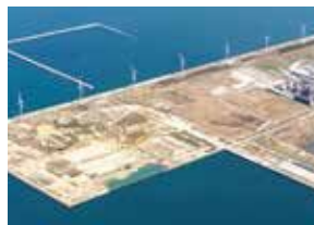
響灘地区港湾(整備実施中)

北九州市は、若松区響灘地区のポテンシャルを活かし、風力発電関連産業の「総合拠点」の形成に向けた取組を進めています。