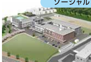
特別支援学校の整備(イメージ)