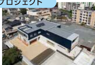
保育所等の整備(イメージ)

これらは、今年度発行する「北九州市SDGs未来債」全体の充当予定事業の一例であり、第三者機関から「国際資本市場協会(ICMA)の定めるサステナビリティボンドガイドライン、グリーンボンド原則、ソーシャルボンド原則に適合」との評価を受けています。