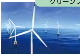
洋上風力発電関連事業(イメージ)