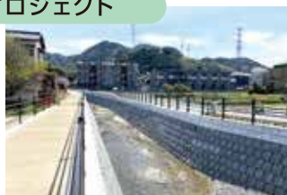
豪雨災害等から市民を守るための防災対策事業(イメージ)